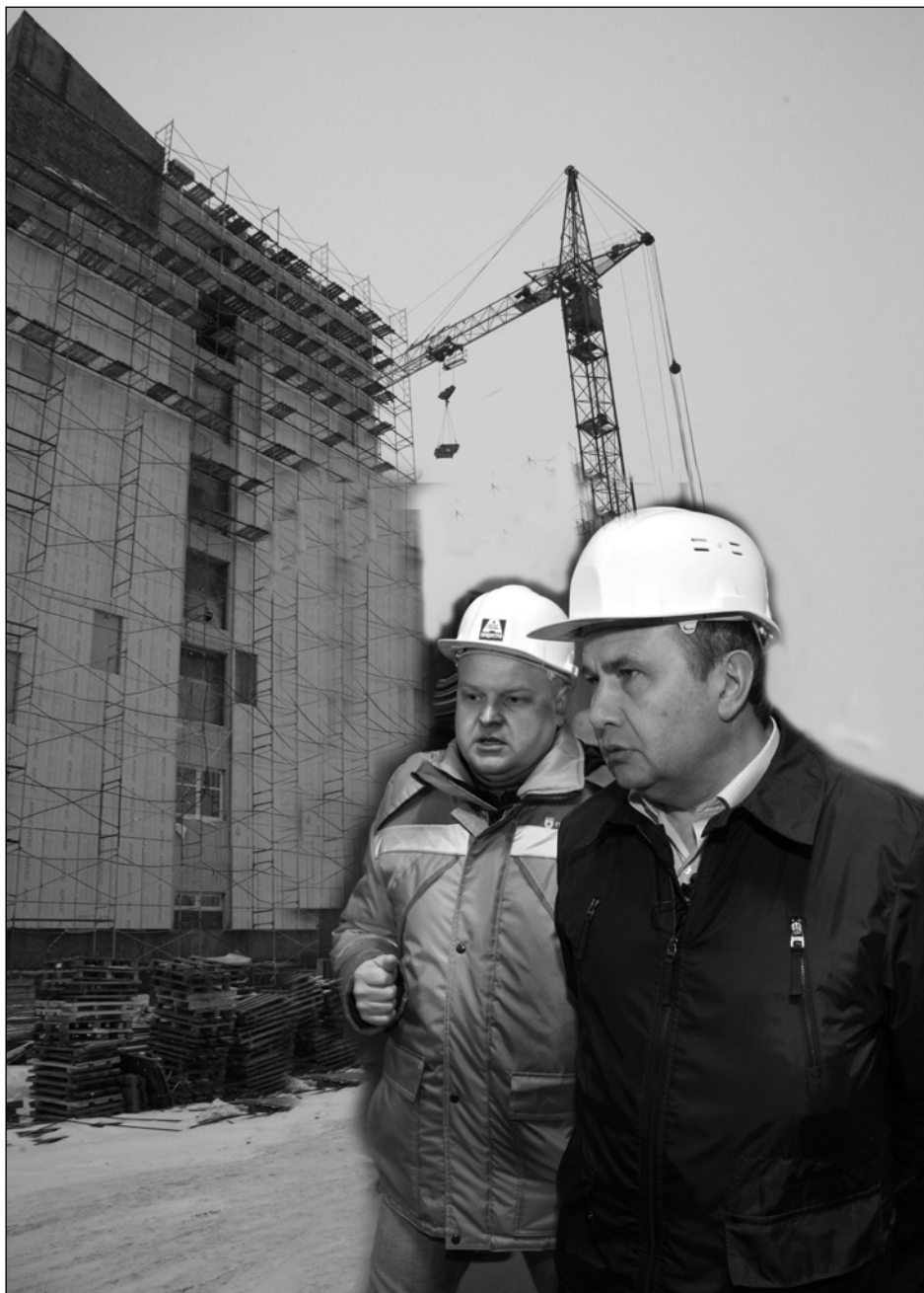
Олег Чиркунов: — Опыт строительства таких современных медицинских центров нам еще пригодится в будущем.

Напомним, строительство в Перми «Города Сердца» входит в Семь важных дел главы региона. Ход реализации этого