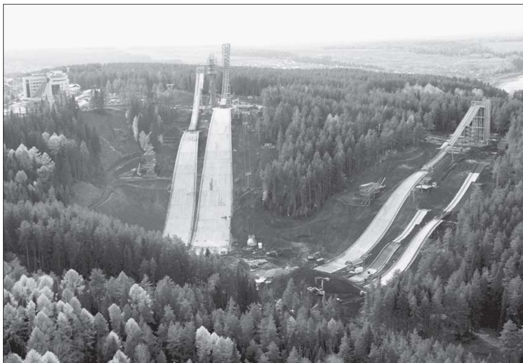
Стройка трамплинов в Чайковском поражает поистине олимпийским размахом