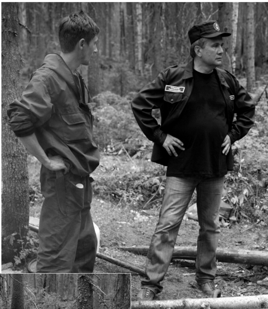
Губернатор Олег Чиркунов лично выехал в Гайнский район, чтобы на месте оценить ситуацию с лесными пожарами.

В начале прошлой недели в Гайнский район Коми округа вылетел губернатор Олег Чиркунов, чтобы лично оценить обстановку с лесными пожарами. В Се-