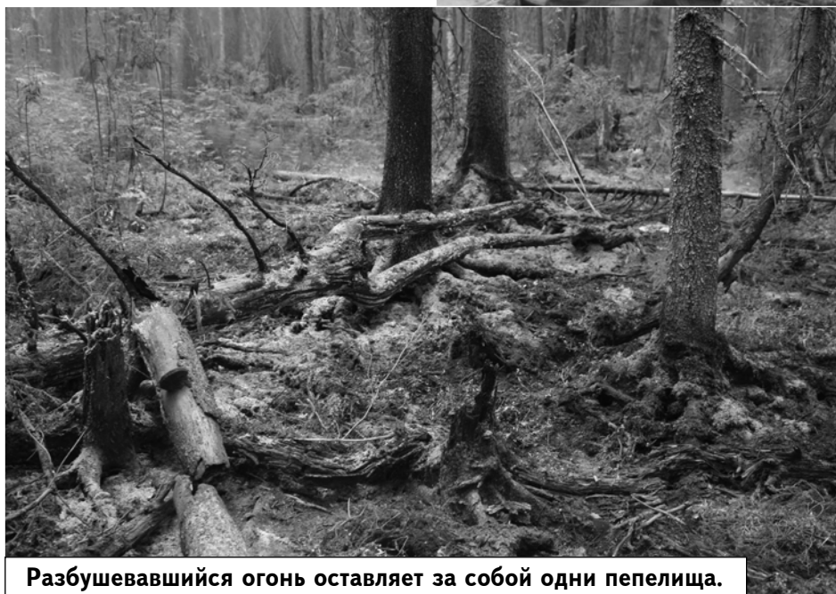
Разбушевавшийся огонь оставляет за собой одни пепелища.

ребрянском сельском поселении — а это 400 км на север от Перми — глава региона встретился с местными жителями и провел оперативное совещание с ответственными за ситуацию с возгораниями. Затем губернатор отправился к месту горения в 93-м квартале Гайнского лесничества. Добраться туда было не так-то просто. Чтобы понять, что действительно там происходит, насколько опасна ситуация, пришлось совершить пятикилометровый пеший марш-бросок по бурелому.