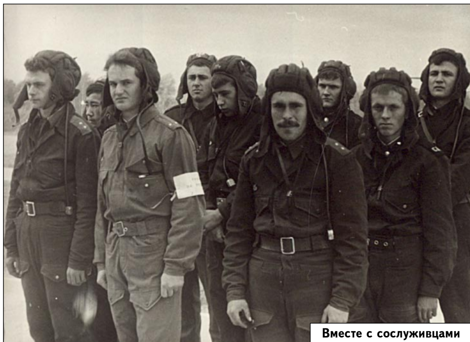
Вместе с сослуживцами